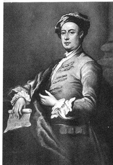
Haendel d'après Turner

L orsque, arrivant de sa Saxe natale et après un premier contact avec l'univers de l'opéra à Hambourg, le jeune Haendel arrive en Italie puis à Rome au début de l'année 1707, il est loin de se douter de l'influence qu'aura le monde du bel canto naissant sur l'ensemble de son immense carrière musicale.