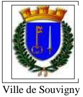
Ville de Souvigny